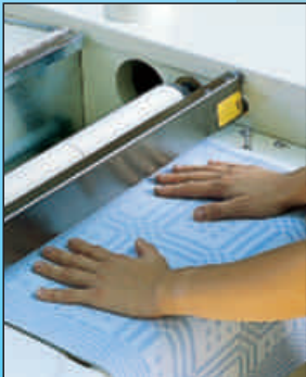
Fingerschutz - Salvamani Safety device for hands Sécurité protège doigts